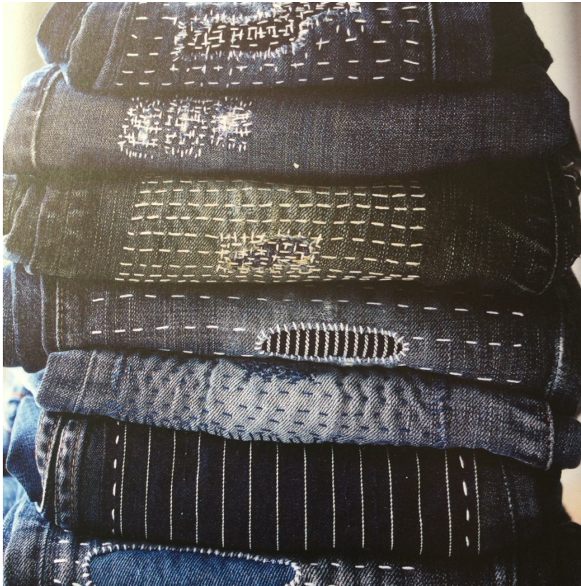
Foto: Titelseite Buch Stich für Stich – kreativ reparieren von Katrina Rodabaugh