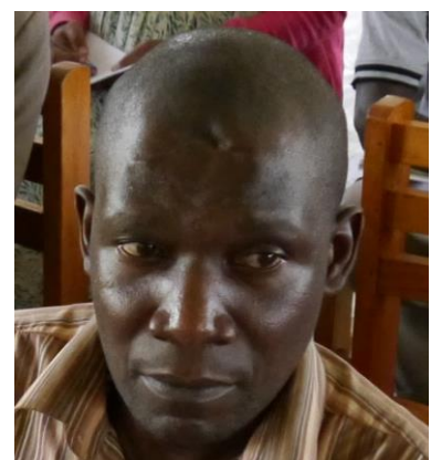
Nationalsekretär Charles Bukenya