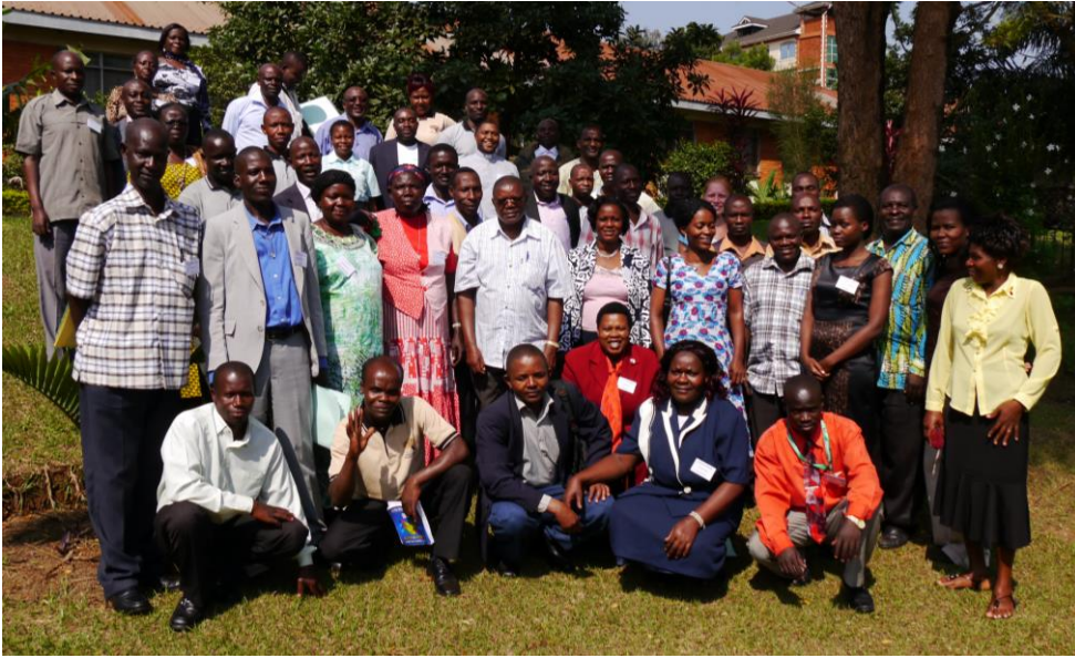
Delegiertenkonferenz alle 5 Jahre

Vorsitzender/e Stellvertreter/in Kassierer/in Vertr. Frauen Vertr. Jugend Nationaler- Projekt- Koordinator/in Hauptamtlicher/e