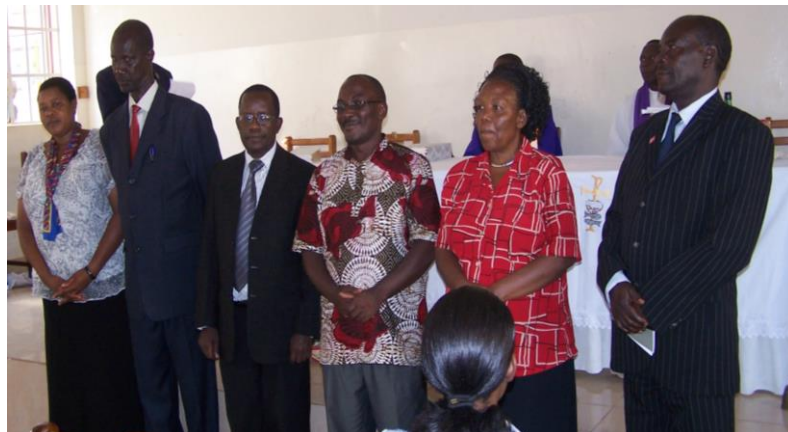
NEXCO National Executive-Committee

Vorsitzender/e Stellvertreter/in Kassierer/in Vertr. Frauen Vertr. Jugend Nationaler- Projekt- Koordinator/in Hauptamtlicher/e