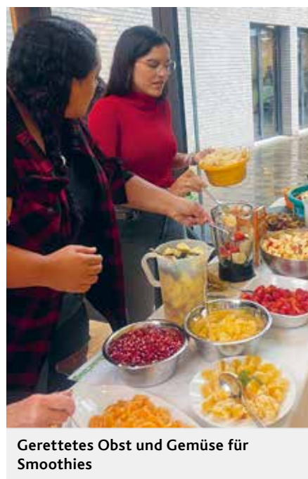
Gerettetes Obst und Gemüse für Smoothies

Zwischen 11 und 14 Uhr kamen rund 350 Menschen aus allen sozialen Schichten, junge Familien mit Kindern, Menschen, die einfach nur mal schauen wollten und dann doch Platz nahmen und auch Frauen und Männer, die froh waren, am Ende des Monats eine warme und kostenlose Mahlzeit zu bekommen. Viele Gespräche wurden geführt. Eine Besucherin meinte, das sei für sie gelebte Kirche.