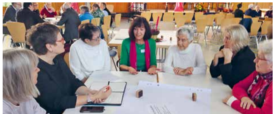
Lebhafte Diskussionen um das Positionspapier mit Politikerinnen und Politikern aus dem Bundestag und Landtag BaWü.

Den ersten Aufschlag hierzu konnte man am Sonntagvormittag erleben. Anstatt eines üblichen „Podiumsdiskussions-Rituals“ diskutierten namhafte Sozialpolitiker und -politikerinnen in wechselnden Tischgruppen mit den KAB-Frauen und -Männern die Forderungen aus dem Positionspapier.