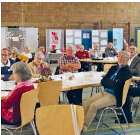
Aufmerksame Delegierte: Vertreter und Vertreterinnen aus den KAB-Gruppen und Bezirken.

Doch dieses Abschieben der Verantwortung auf „die da oben“ lässt die KAB nicht stehen. Mit einem Positionspapier verabschiedeten die 65 Delegierten aus den Ortsgruppen und Bezirken gemeinsam mit dem Diözesanvorstand einige wesentliche Forderungen, die sie mit namhaften Sozialpolitikern und -politikerinnen diskutierten. Dafür gab es auf dem Verbandstag am Sonntagmorgen ein „teilnehmerorientiertes Debattenformat“. In wechselnden Tischgruppen kam es zu lebhaften Diskussionen mit den Politiker*innen „auf Augenhöhe“ aus CDU-CDA, SPD, Bündnis 90 / Die Grünen und der FDP.