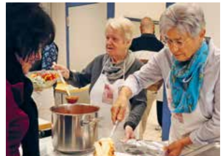
Eingespieltes Team bei der Essensausgabe

Die KAB Remshalden stemmte das Großereignis mit Bravour: die liebevolle Gestaltung und Dekoration der Wilhelm-Enfle-Halle, die reibungslose Essensausgabe und das hervorragende Catering, die gesamte Vor-Ort-Organisation im Hintergrund und die Herzlichkeit der ehrenamtlichen Helferinnen und Helfer haben viel zur guten Stimmung des Verbandstages beigetragen.