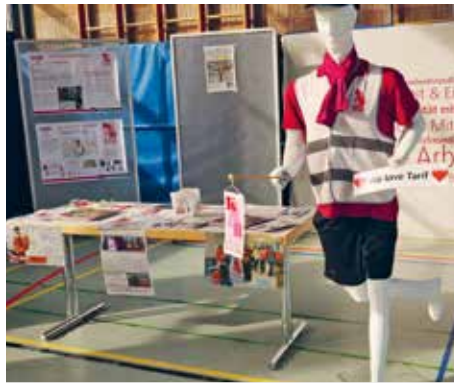
Ohne Stimmrecht: Kollege Lieferando