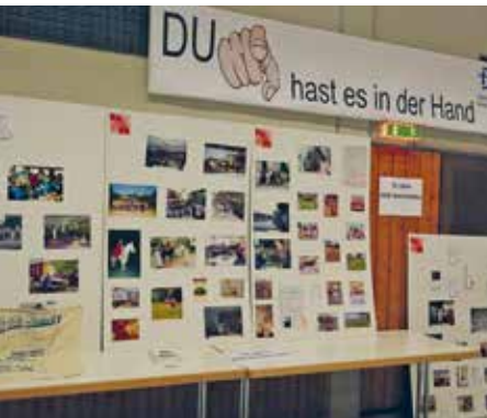
Der Stand der Gastgeberin, KAB Remshalden, die erst vor kurzem ihr 70-jähriges Gründungsjubiläum feiern durfte.

Wir leben in und profitieren von einer Sorggemeinschaft, die vom Grund her solidarisch angelegt ist. Dennoch sind die Lasten ungleich verteilt. Es sind die Frauen, die die Hauptlast von Erziehung, Pflege und Nachbarschaftshilfe meist unentgeltlich leisten. Daher setzt sich die KAB für ein ganz neues Verständnis der Tätigkeitsgesellschaft und für eine geschlechtergerechte Verteilung der Aufgaben in einer sorgenden Gesellschaft ein. Care-