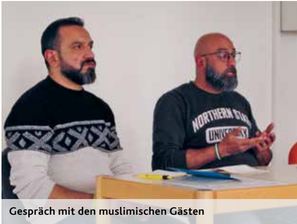
Gespräch mit den muslimischen Gästen

Die Senioren-Einkehrtage fanden dieses Jahr vom 24. bis 26. März statt und wurden wieder von Pater Becker gehalten. Zu Beginn wurde der Islam aus Sicht der Religionswissenschaft eingeordnet mit den Fragen: