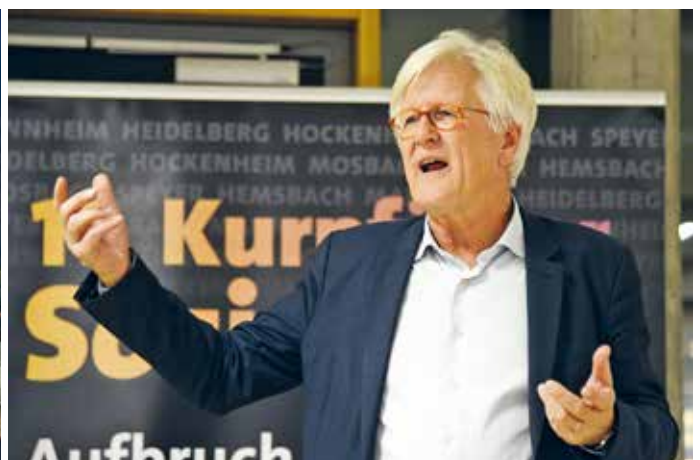
Bischof Heinrich Bedford-Strohm