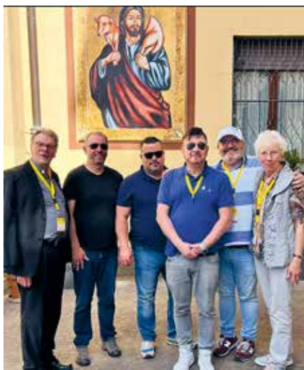
KAB-Mitglieder auf der Pilgerreise

Kurz vor dem Abflug am Ostermontag erreichte uns die traurige Nachricht vom Tod unseres Papstes Franziskus. Die geplante Audienz beim Papst wurde im