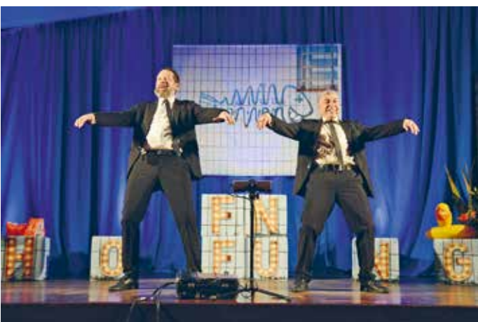
Kabarett Onkel Fisch

In den zukünftigen Monaten und Jahren bleibt abzuwarten, was aus den Diskussio-