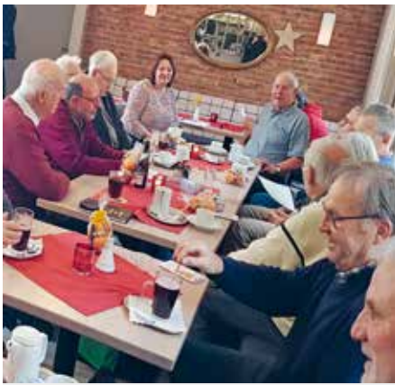
Stammtischbesucher im Dezember 2024

Der Stammtisch des Bezirkes TBB ist immer sehr gut besucht; manchmal gibt es auch Überraschungen: