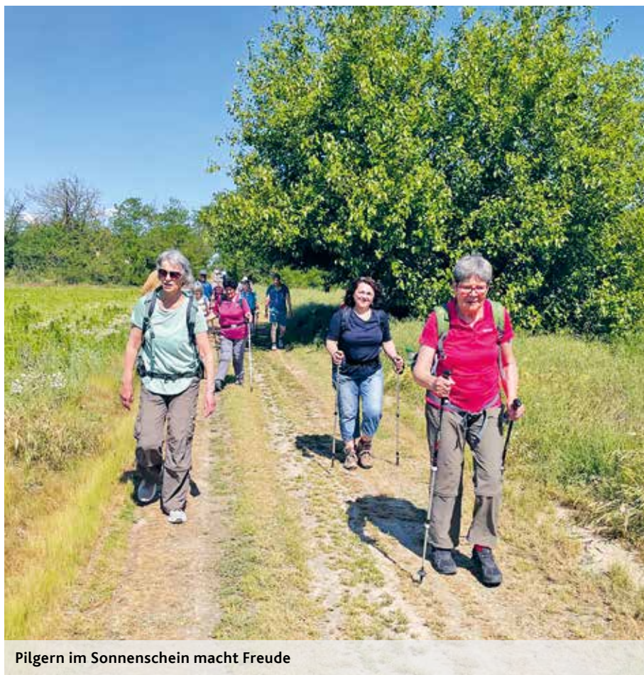
Pilgern im Sonnenschein macht Freude

Leider wurde unser Pilgerweg überschattet von einem Einbruch in unseren Bus, bei dem alle unsere Koffer entwendet wurden. Diese wurden geöffnet auf einem Feld wiedergefunden. Nur mit Mühe konnten wir alle unsere Sachen wieder den richtigen Besitzerinnen und Besitzern zuordnen. Das Geld aus den Koffern und einige weitere Utensilien sind für immer weg.