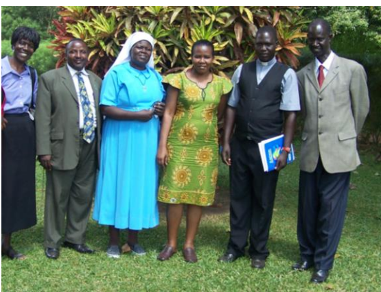
DEXCO Mitglieder mit Nationalsekretär und Nationaler Administratorin

Ein Diözesan-Executive-Committee (DEXCO) plant und leitet mit der Diözesansekretärin die Aktivitäten in der Erzdiözese Gulu.